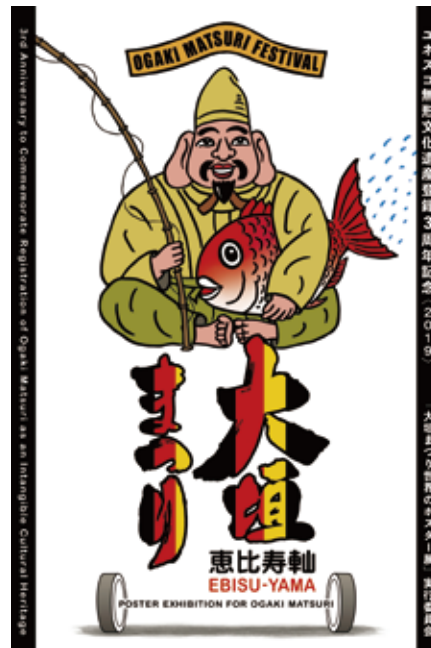
【恵比須軸】デザイン:U.G.サトー