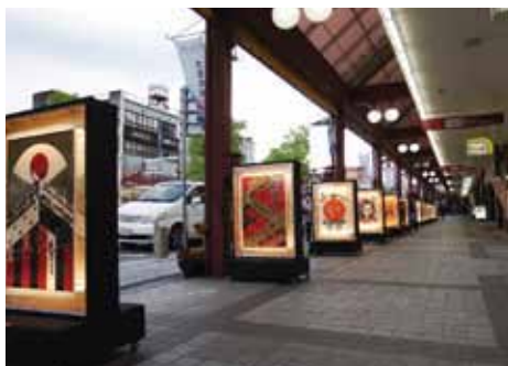
あかりポスター展