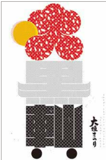
【大黒軸】デザイン:南部俊安