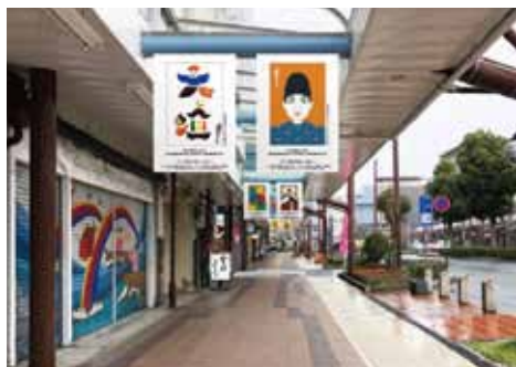
ポスターフラッグ展(イメージ)