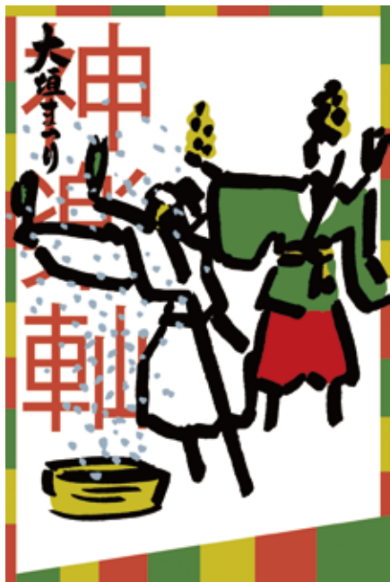
【神楽軸】デザイン:加藤由朗